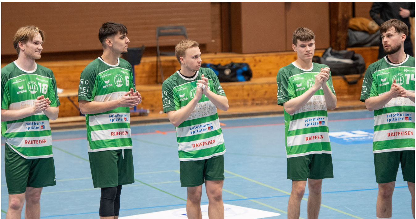
Der HV Olten trifft in der Gruppe 2 auf den freiwilligen QHL-Absteiger HSC Kreuzlingen.